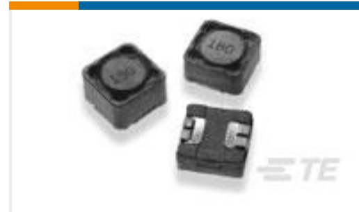
TE 产品编号1-1625812-2 3631B 47UH 15% FIO