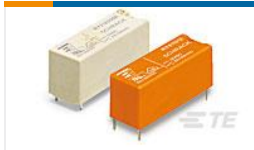
TE 产品编号5-1393224-2 RY212005