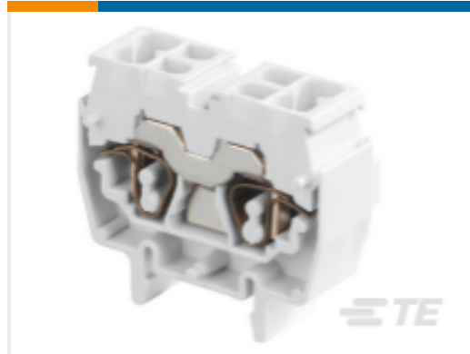
TE 产品编号1SNA290213R0400 DR2.5/10.N.4L