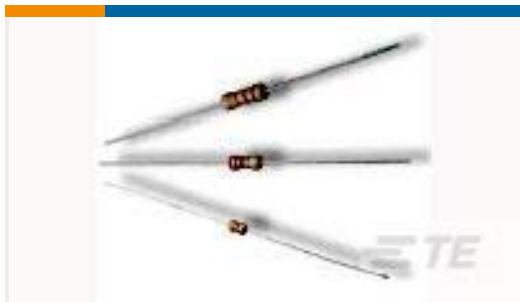
TE 产品编号4-1623927-3 CFR16 5% 1R8