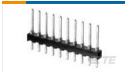
TE 产品编号825440-4 MOD 2 PINHDR 2X04P.