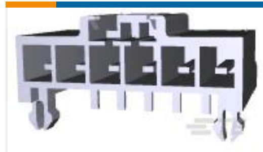
TE 产品编号178499-1 UP 3.96 6P TAB HDR NATL TYPE 1