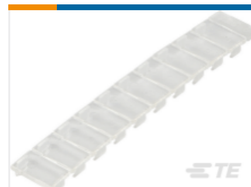
TE 产品编号1SNK900609R0000 PROCAP5