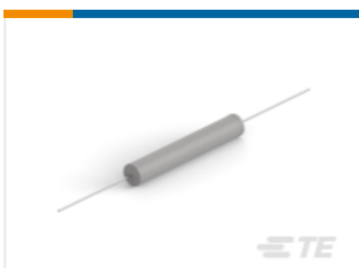
TE 产品编号6-2176416-8 9W STD M/OX 5% 33K