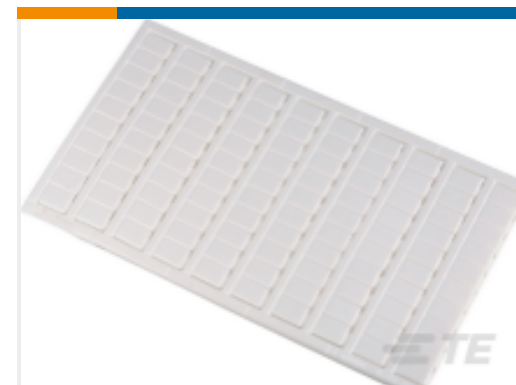
TE 产品编号1SNK169001R0000 MC812PA L1-L2-L3-N-PE (x20) Horizontal