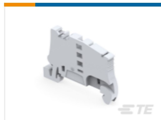
TE 产品编号1SNK900002R0000 BAZ1