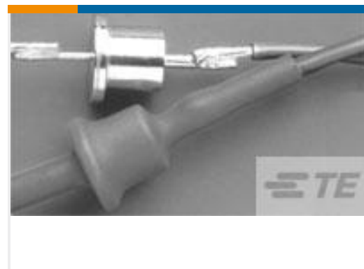
TE 产品编号5677562009 RNF-3000-3/1-0-STK