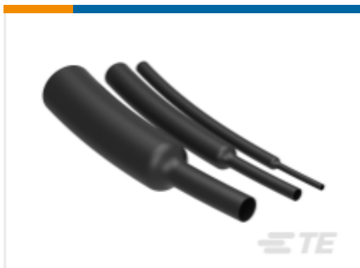
TE 产品编号1243436001 CGPT-R-19-0