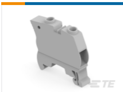
TE 产品编号1SNK510010R0000 ZS16