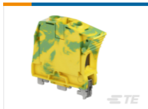
TE 产品编号1SNK516150R0000 ZS35-PE