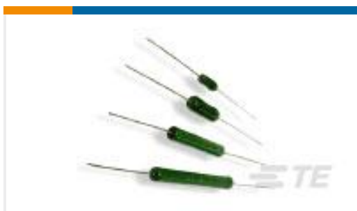
TE 产品编号1-1623773-1 C10 1K0 5% (LOOSE)