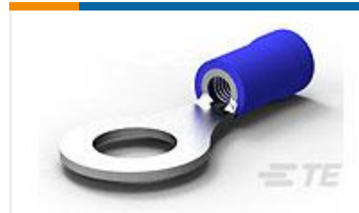
TE 产品编号34162 TERMINAL, PG R 16-14 1/4