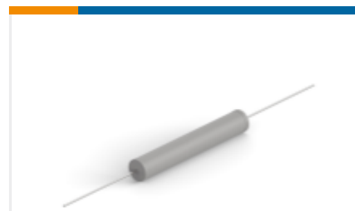
TE 产品编号3-2176416-9 9W STD M/OX 5% 2K0