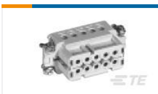
TE 产品编号1-1103415-1 HA.10.BU.S.B1-10