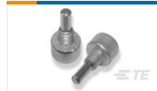
TE 产品编号3-1625931-9 MCU 220R 10% 1" PL