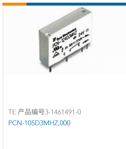
TE 产品编号3-1461491-0 PCN-105D3MHZ,000