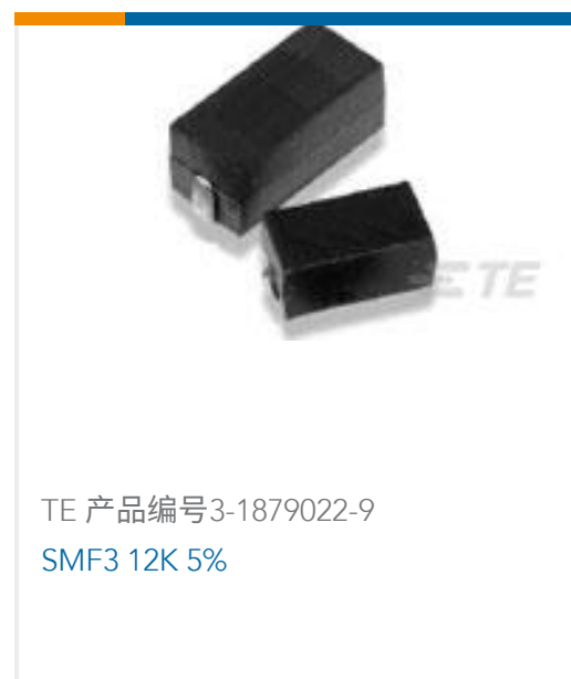
TE 产品编号3-1879022-9 SMF3 12K 5%