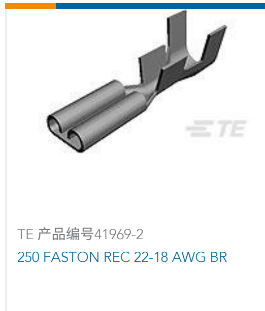
TE 产品编号41969-2 250 FASTON REC 22-18 AWG BR