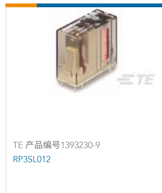
TE 产品编号1393230-9 RP3SL012