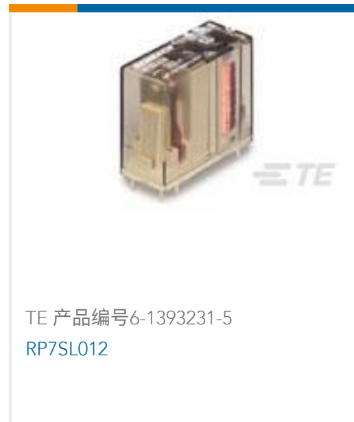
TE 产品编号6-1393231-5 RP7SL012