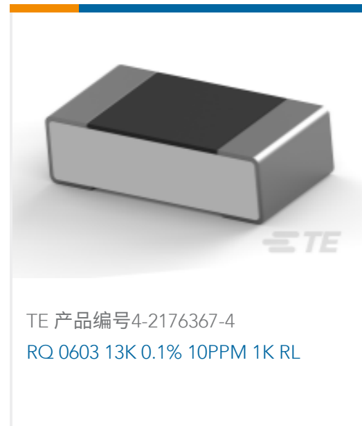
TE 产品编号4-2176367-4 RQ 0603 13K 0.1% 10PPM 1K RL