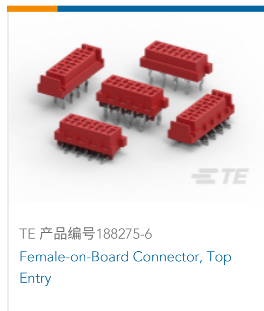
TE 产品编号188275-6 Female-on-Board Connector, Top Entry