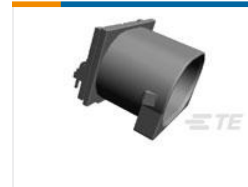
TE 产品编号1-967658-1 8pos MQS .63 header 90deg