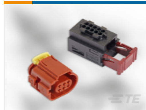
TE 产品编号1-967621-3 Timer Connector Housing