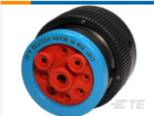
TE 产品编号HDP26-24-9SE-L017 PLG, 9P, BLK, E, RNG, 4/8/12, S