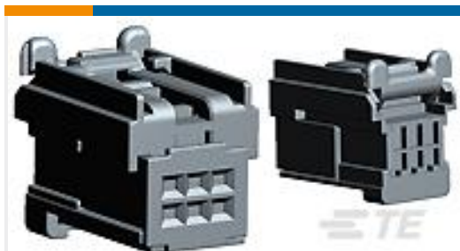
TE 产品编号 1419158-5 MARKT2X3SWIT CONN.B