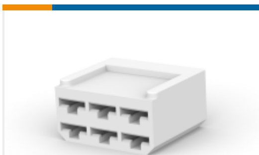
TE 产品编号880297-1 6 WAY FF 250 HOUSING REC PA 6.6 NATURAL