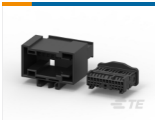
TE 产品编号1379217-6 MQS 连接器外壳