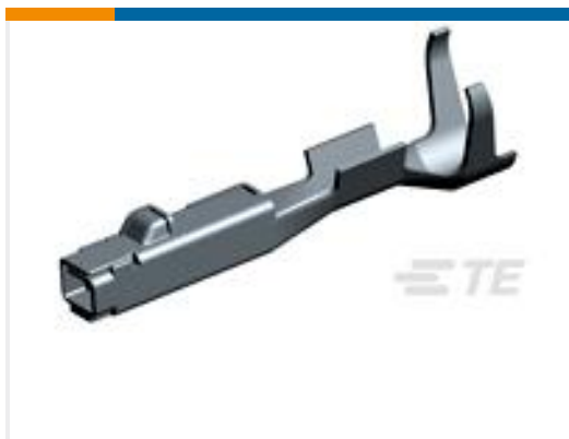
TE 产品编号1418844-1 MCON 1.2 CB REC SWS SN