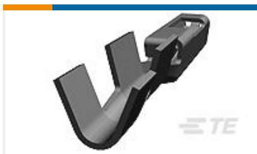
TE 产品编号638551-1 CONTACT,FEMALE,0.64MM,SN,18-20