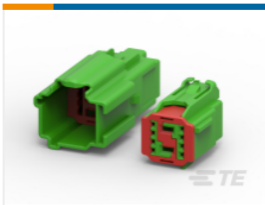
TE 产品编号1419158-5 GET .64 连接器系统, 连接器壳体