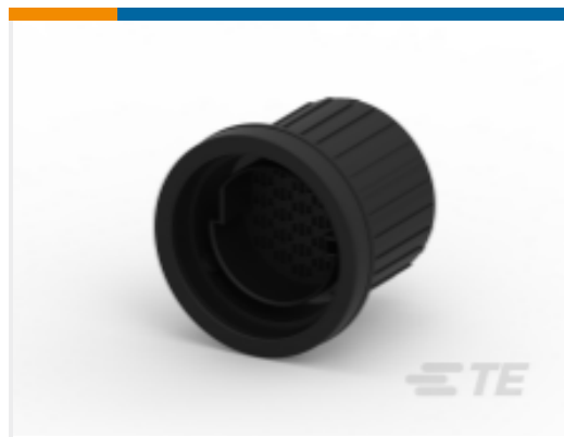
TE 产品编号963328-1 24P STECK-GEH KPL