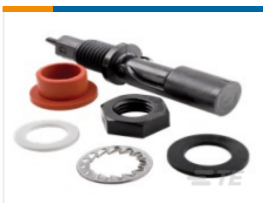
TE 产品编号80645-000 LS809-51 Liquid Level Sensor