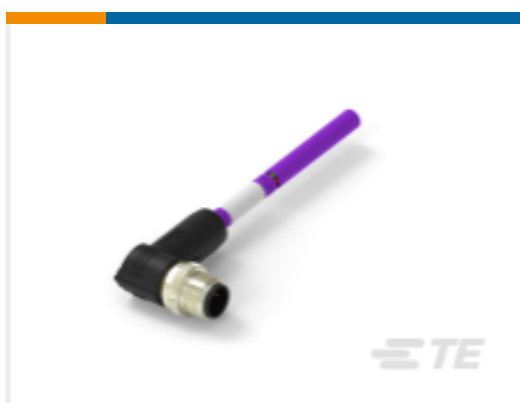
TE 产品编号TAB62246501-040 M12B2-MR-PUR TORSION-4.0M