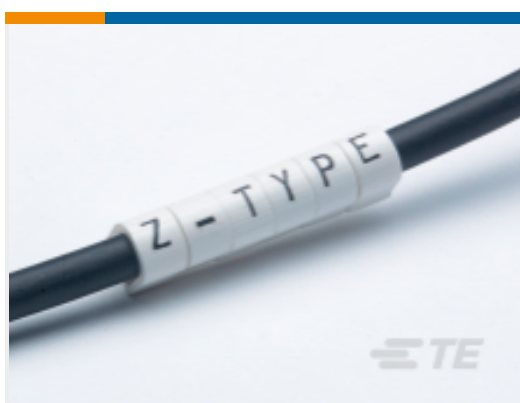
TE 产品编号EJ1953-000 06151413