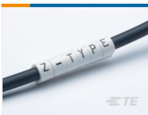
TE 产品编号EC0366-000 Z-Type Push-On Markers