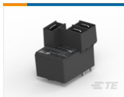
TE 产品编号1558676-6 T9GS1L24-22