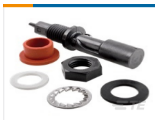
TE 产品编号80645-000 LS809-51 Liquid Level Sensor