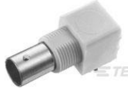
TE 产品编号5227161-2 RTANG JK W/MTG PINS, BNC PCB