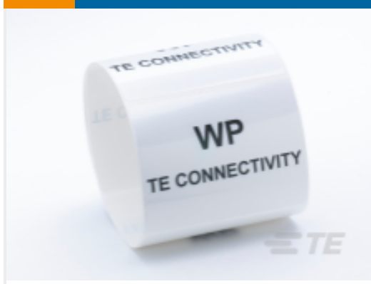
TE 产品编号F01667-000 WP White Polyester Labels