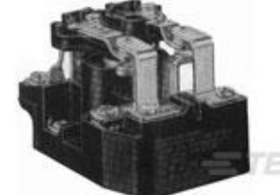
TE 产品编号9-1393129-5 PRD-7AG0-120=PRD