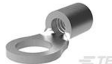
TE 产品编号8-33457-1 TERMINAL,SOLIS R 12-10 10