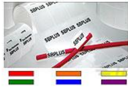
TE 产品编号CN2893-000 SBP050143WE10