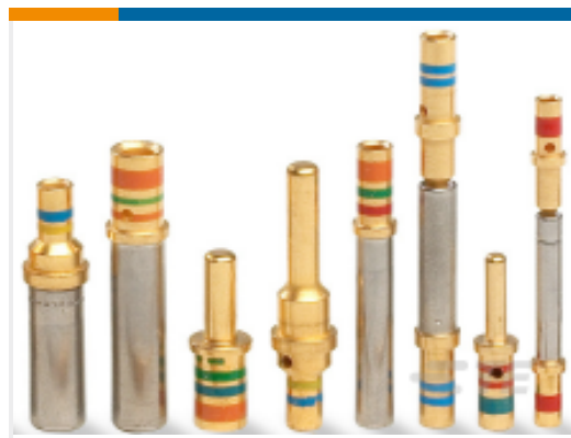
TE 产品编号2562-209-2031 CONT SOC ASSY