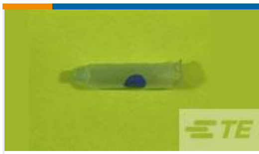
TE 产品编号617867-000 D-436-0186