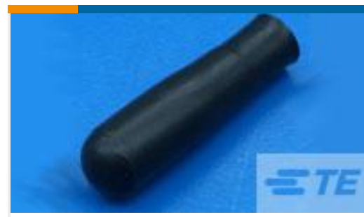
TE 产品编号610015-000 D-300-02