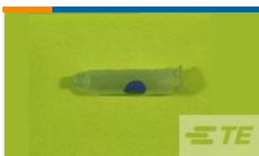
TE 产品编号617867-000 D-436-0186