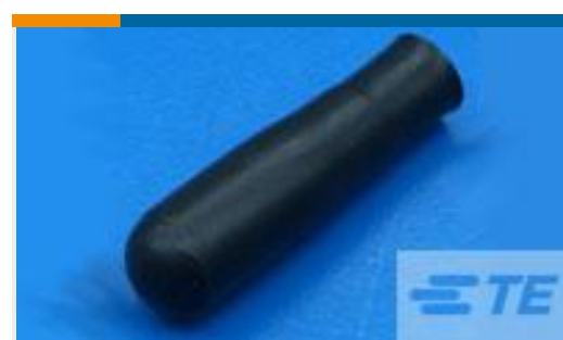
TE 产品编号610015-000 D-300-02