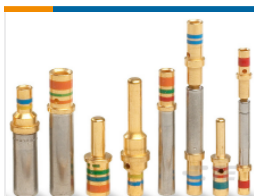
TE 产品编号2562-209-2031 CONT SOC ASSY