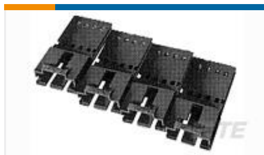
TE 产品编号103653-3 04 MTE SHRD PIN HSG SR LATCH