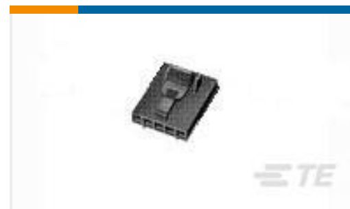
TE 产品编号104257-3 04 MTE RCPT HSG SR LATCH .100