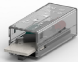
TE 产品编号 5-1415036-1 PTML0024