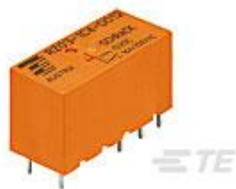
TE 产品编号 1-1415899-1 RZ01-1C4-D024