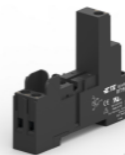
TE 产品编号 8-1415035-1 RT78724