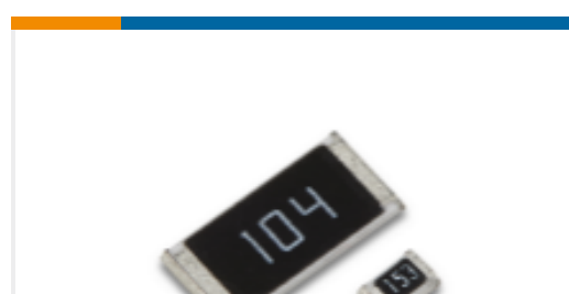
TE 产品编号3-2176349-0 CRGCO 2512 2K7 1%