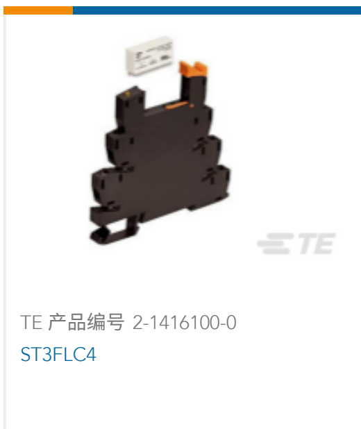
TE 产品编号 2-1416100-0 ST3FLC4