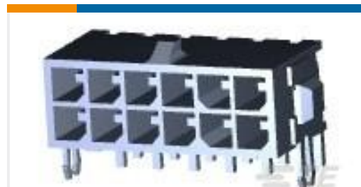
TE 产品编号4-794677-2 12POS MICRO MNL ASSY,R/A,THRU