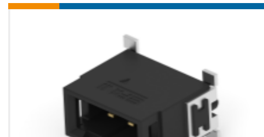
TE 产品编号294645-E SRCP 2,54 2 M 1 SMD 137 E1 094 * GU-H *