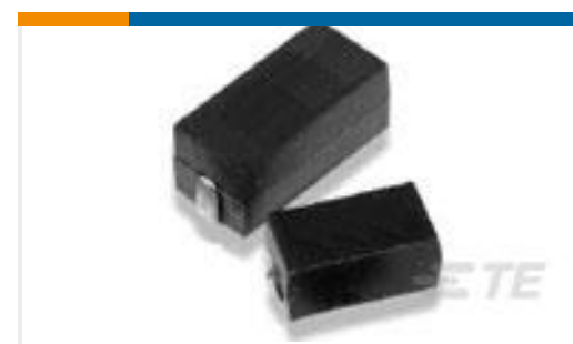
TE 产品编号7-1879233-1 SMW5 82R 5%