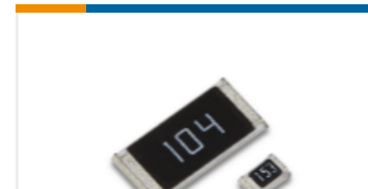
TE 产品编号1-2176349-5 CRGCO 2512 150R 1%