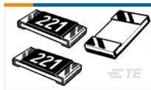
TE 产品编号5-2176231-2 3522 1K3 1% 3W