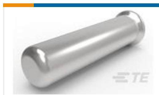
TE 产品编号50935 SOCKET,MIN-SPR AU-AU SER-1