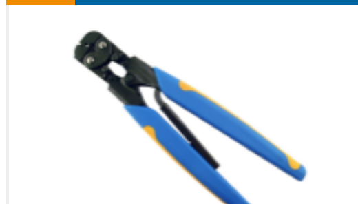
TE 产品编号68262-1 DAHT SOLIS 14-10 ASSY