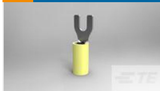
TE 产品编号8-35152-2 TERMINAL,PIDG SPD 12-10 8