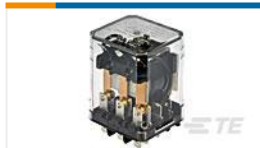
TE 产品编号8-1393117-0 KUP-14A15-240=KU