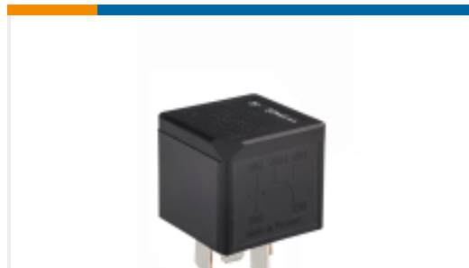
TE 产品编号1-1414686-0 V23136A0004X058-EV-CBOX