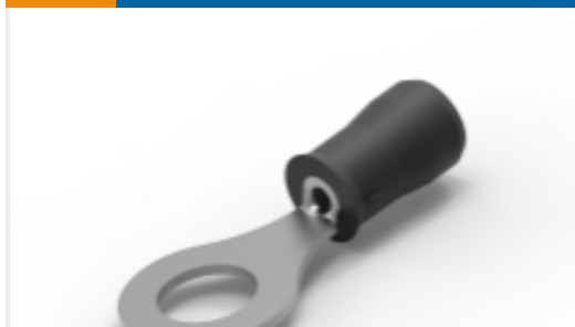
TE 产品编号2-320563-3 PIDG Ring Tongue Terminals