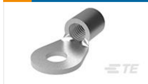
TE 产品编号320754 TERMINAL,SOLIS R 2 5/8