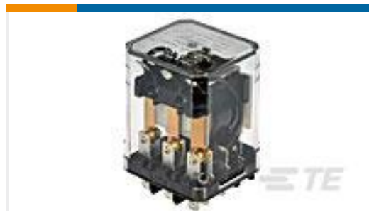
TE 产品编号9-1393116-0 KUMP-14D18-12=KU