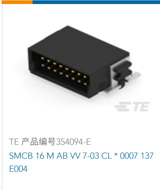
TE 产品编号354094-E SMCB 16 M AB VV 7-03 CL * 0007 137 E004