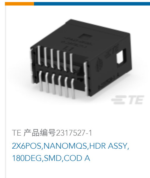
TE 产品编号2317527-1 2X6POS,NANOMQS,HDR ASSY, 180DEG,SMD,COD A