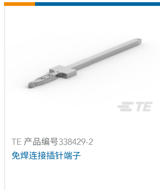
TE 产品编号338429-2 免焊连接插针端子