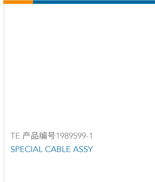
TE 产品编号1989599-1 SPECIAL CABLE ASSY