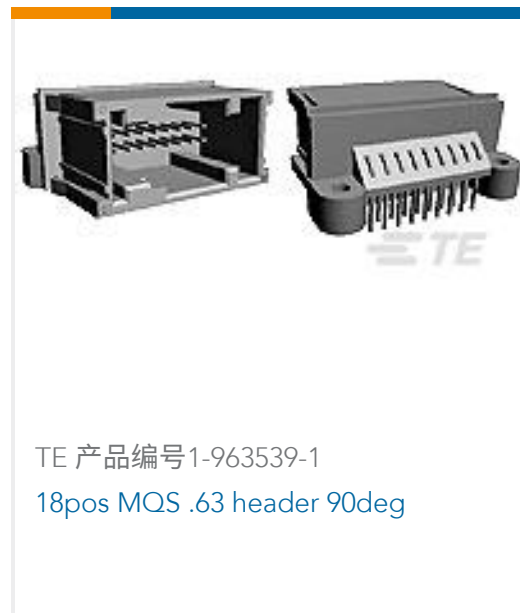
TE 产品编号1-963539-1 18pos MQS .63 header 90deg