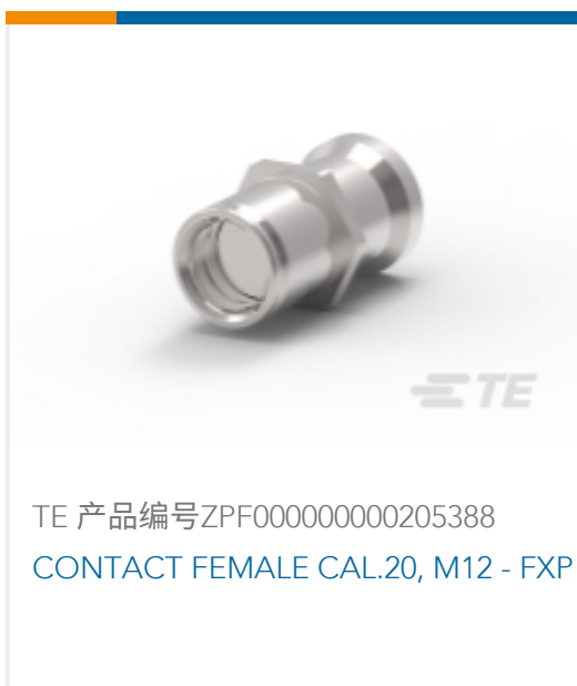
TE 产品编号ZPF000000000205388 CONTACT FEMALE CAL.20, M12 - FXP