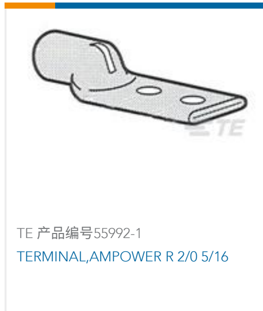
TE 产品编号55992-1 TERMINAL,AMPOWER R 2/0 5/16