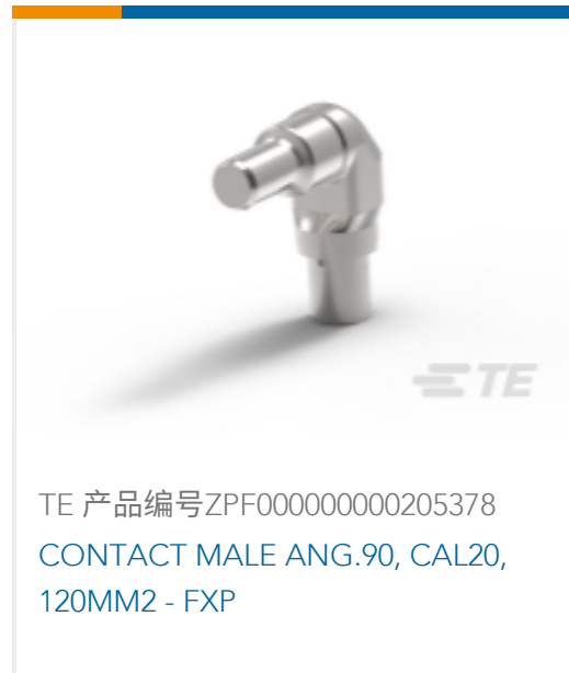
TE 产品编号ZPF000000000205378 CONTACT MALE ANG.90, CAL20, 120MM2 - FXP