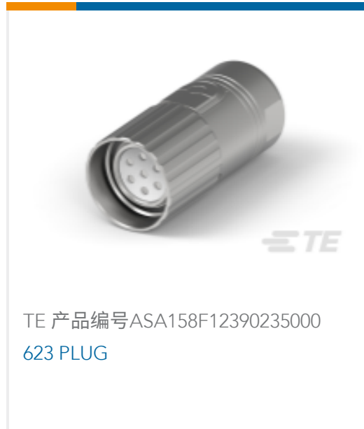
TE 产品编号ASA158F12390235000 623 PLUG