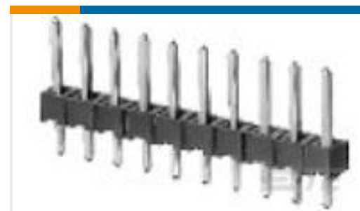
TE 产品编号6-146280-5 15 MODII HDR SRST B/A .100CL