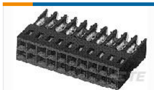
TE 产品编号102393-6 16 AMPMODU MT ASSY DR .100CL