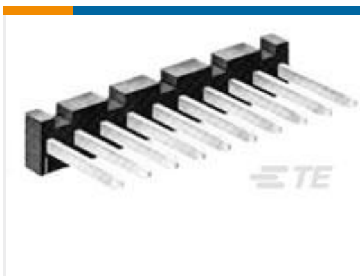
TE 产品编号5-87655-4 04 MODI HDR SRRA .156CL, ROHS