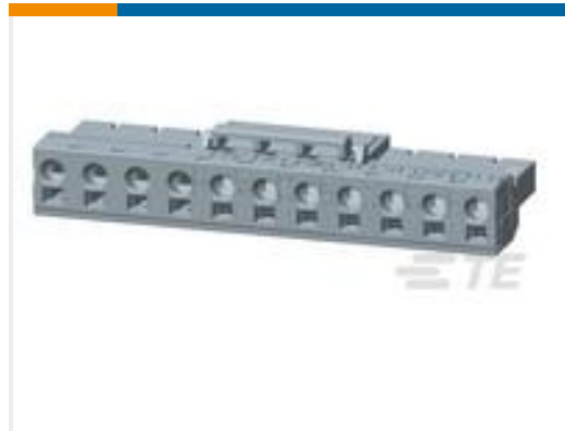
TE 产品编号1-2229794-2 D3950 REC 7/11POS 1ROW Y KEY MARKED