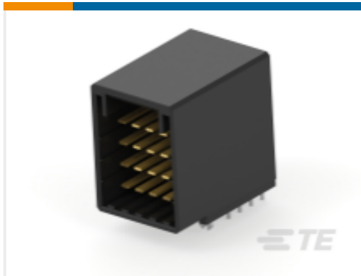
TE 产品编号2-178216-2 Dynamic 3400F HDR 组件