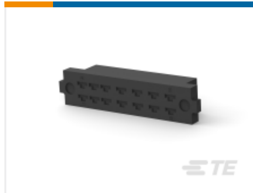
TE 产品编号171090-1 FF 250 REC HSG 14P NYLON