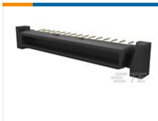
TE 产品编号5917629-5 AMP FH REC V 120P H-9 SIF