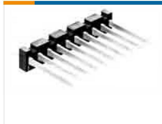
TE 产品编号5-87160-5 03 MODI HDR SRST .156CL, ROHS