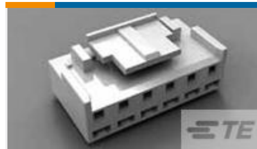
TE 产品编号1-1123722-6 3.96 EP PLUG HSG 6P(NATURAL)