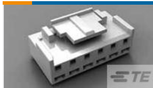
TE 产品编号1-1123722-5 3.96 EP PLUG HSG 5P(NATURAL)