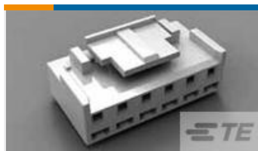
TE 产品编号1-1123722-3 3.96 EP PLUG HSG 3P(NATURAL)