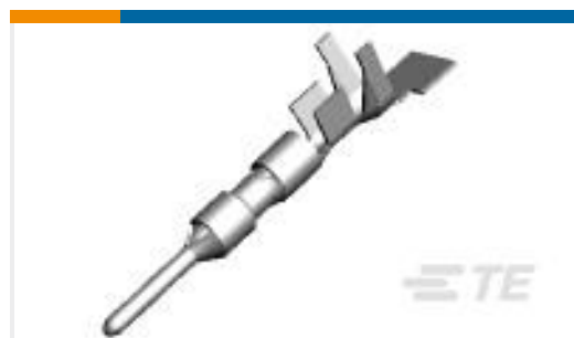
TE 产品编号794220-1 MINI UMNL2 PIN 22-18 AWG SN