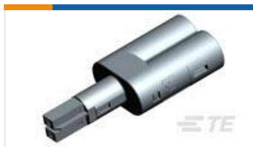
TE 产品编号293650-4 NECTOR S T-SPLITTER STANDARD