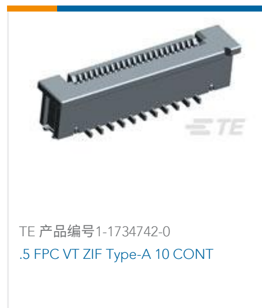
TE 产品编号1-1734742-0 .5 FPC VT ZIF Type-A 10 CONT