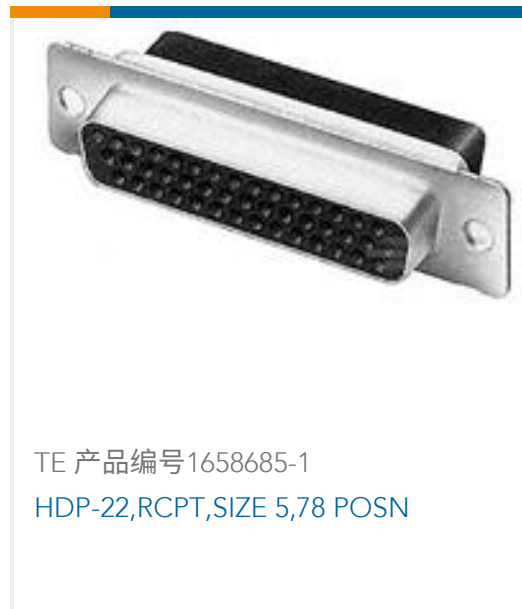
TE 产品编号1658685-1 HDP-22,RCPT,SIZE 5,78 POSN