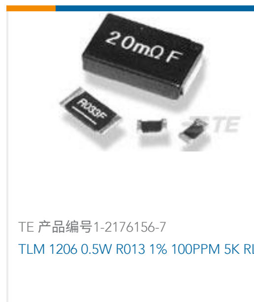
TE 产品编号1-2176156-7 TLM 1206 0.5W R013 1% 100PPM 5K RL