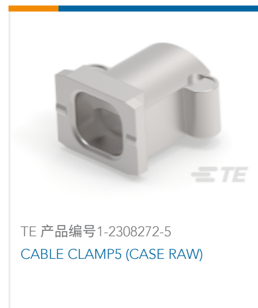
TE 产品编号1-2308272-5 CABLE CLAMP5 (CASE RAW)