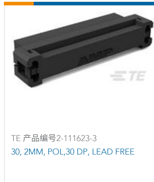
TE 产品编号2-111623-3 30, 2MM, POL,30 DP, LEAD FREE