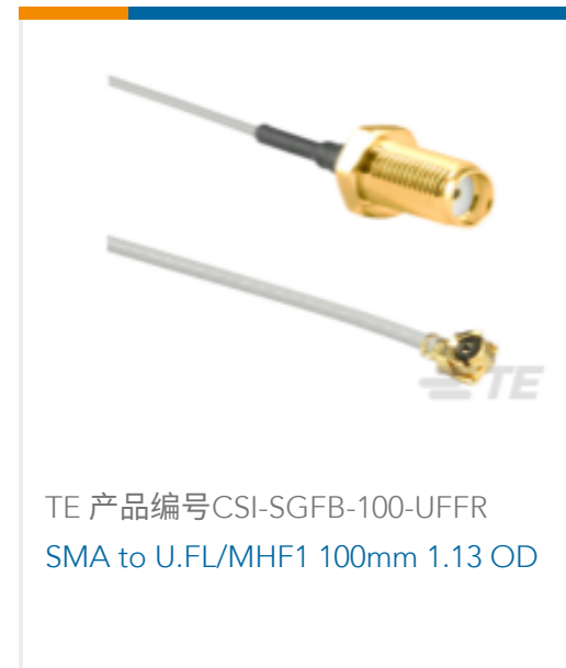
TE 产品编号CSI-SGFB-100-UFFR SMA to U.FL/MHF1 100mm 1.13 OD