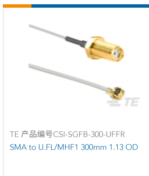
TE 产品编号CSI-SGFB-300-UFFR SMA to U.FL/MHF1 300mm 1.13 OD