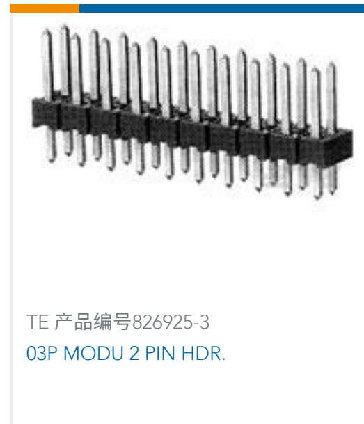
TE 产品编号826925-3 03P MODU 2 PIN HDR.