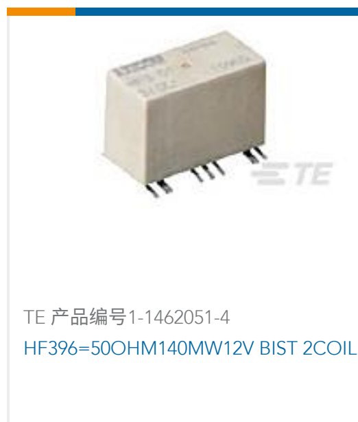
TE 产品编号1-1462051-4 HF396=50OHM140MW12V BIST 2COIL