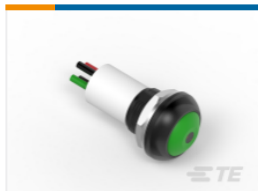
TE 产品编号1-2329388-7 PB OFF/ON FC GRE M1 TERM RED LED IP68 50