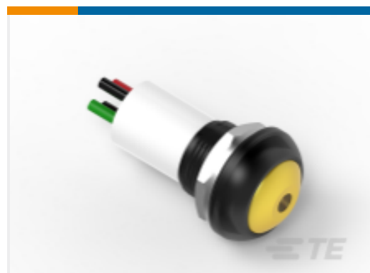
TE 产品编号1-2329388-2 PB OFF/ON FC YLW M1 TERM RED LED IP68 50