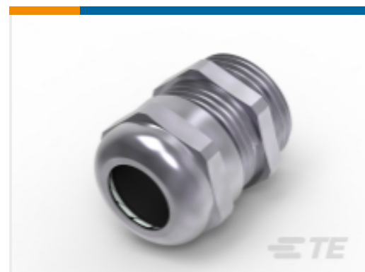
TE 产品编号T3609360101-000 DLX-36-MS (22-32)