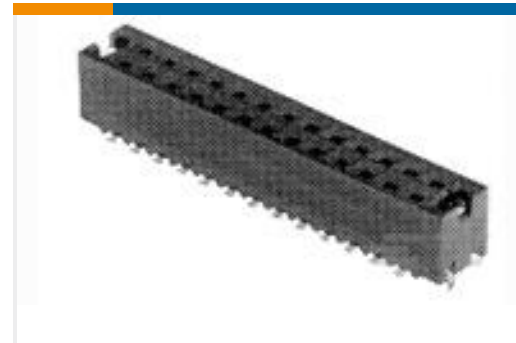
TE 产品编号1-147747-7 34 MODIV VRT DR SFMNT 30AU