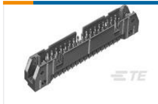
TE 产品编号5111008-9 A/L UNIV HDR 40P VERT HT