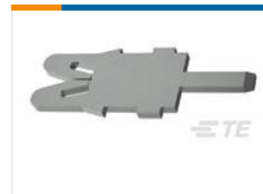
TE 产品编号1601128-4 TAB,PCB,FINE,SMZ