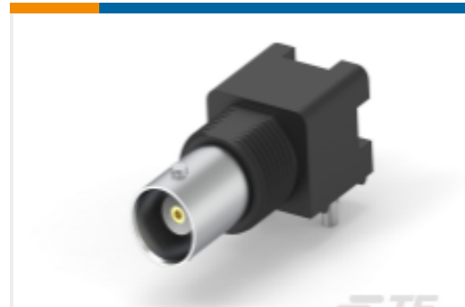
TE 产品编号1-5227161-8 RTANG JACK W/MTG PINS,BNC PCB