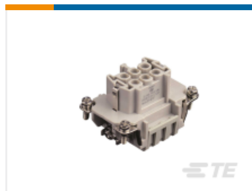
TE 产品编号T2040064201-000 HE-006-FC