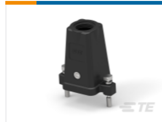
TE 产品编号T1926030116-009 H3APR-TGC-M16-EMC-C