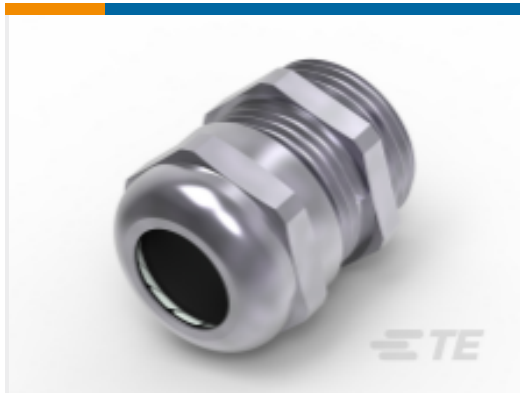
TE 产品编号T3609200102-000 DLX-20-M