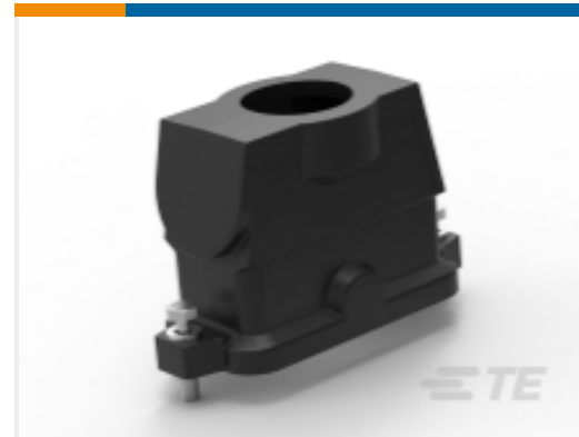
TE 产品编号T1922160140-000 H16BPR-TGHC-M40