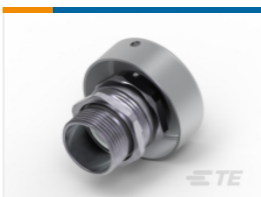
TE 产品编号T3900250250-000 M25X1.5 VA-25-LM