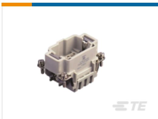
TE 产品编号T2040064101-000 HE-006-MC