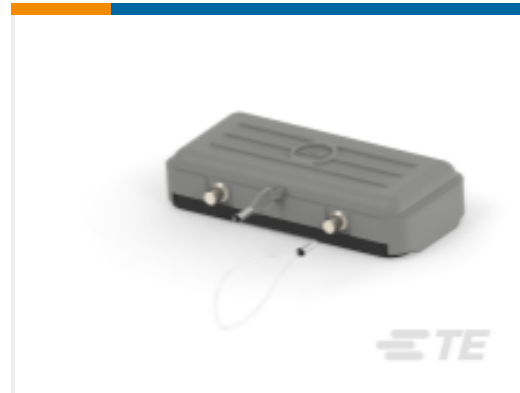
TE 产品编号T1010161600-000 H16B-KDTP-BO