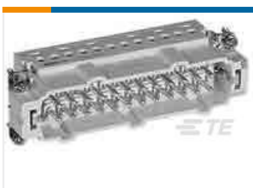
TE 产品编号1-1103640-8 HE24STI S-T.B12+6+6