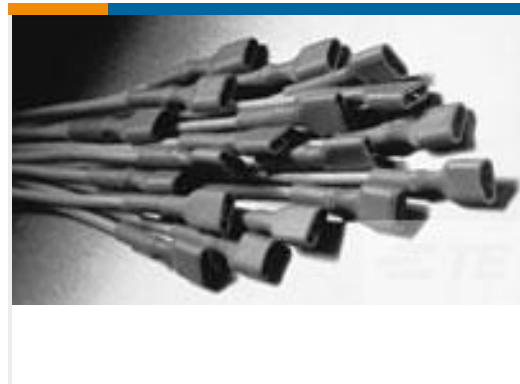
TE 产品编号1963796004 LSTT-R-12.7-0