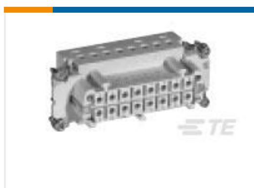
TE 产品编号1-1103639-1 HE.16.BU.S.B 1-16