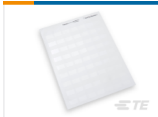
TE 产品编号9-1768016-5 CSL-09333P-9