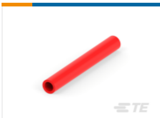
TE 产品编号NB08612001 ATUM-16/4-2-STK