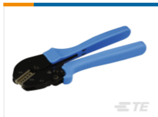
TE 产品编号T3100000001-000 CRIMPBOX-0.14/4.0