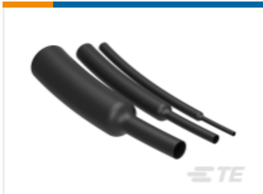
TE 产品编号3251936001 CGPT-R-3.2-0