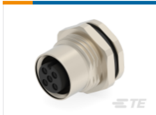
TE 产品编号T4131012051-000 M12,REAR MOUNT,FEMALE,A,5P, SOLDER WIRE