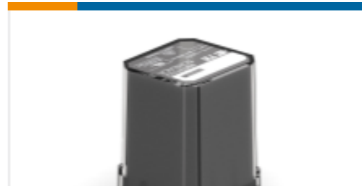
TE 产品编号3-1415546-7 RM727024