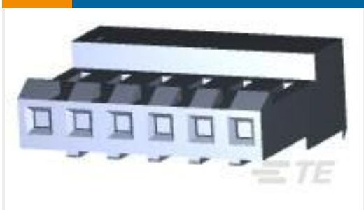
TE 产品编号3-640427-6 06P MTA156 CONN ASSY 20AWG YEL