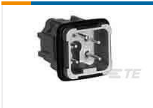
TE 产品编号1-1103402-1 HA.4.Sti.S