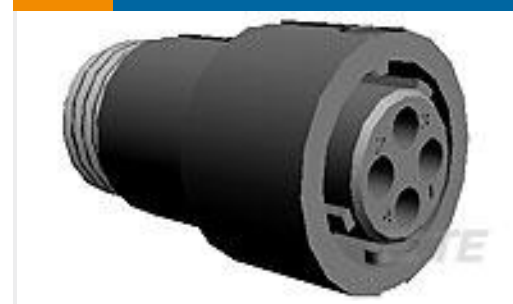
TE 产品编号1445535-3 PLUG,8-2, LG INS, STD KEY