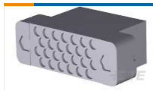
TE 产品编号200512-2 FEMALE BLOCK 26 PL.