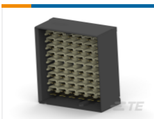
TE 产品编号2187461-1 SW PIR HDR BP, 100OHM, 9X6SP DEW