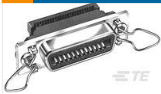
TE 产品编号554902-1 EMI RCPT ASSY,50 POSN,SHLD