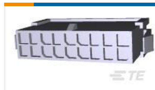
TE 产品编号1-794615-8 PANEL MT DBL ROW HSG 18 POS