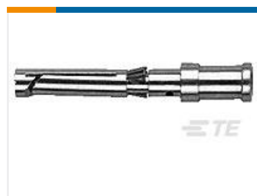
TE 产品编号3-1105051-1 HN.D-C-BU.AG.0,75