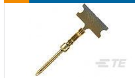
TE 产品编号166293-1 LP HD20 COSI PIN CONTACT DF; 24-20 AWG