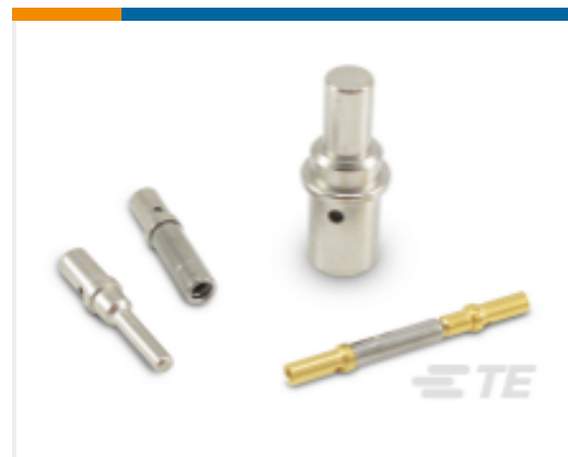
TE 产品编号0460-202-16141 DEUTSCH Solid Contacts