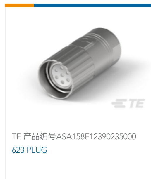
TE 产品编号ASA158F12390235000 623 PLUG