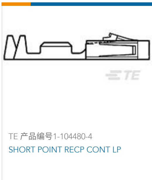
TE 产品编号1-104480-4 SHORT POINT RECP CONT LP