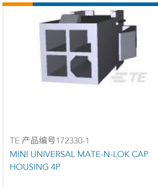
TE 产品编号172330-1 MINI UNIVERSAL MATE-N-LOK CAP HOUSING 4P