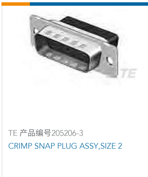
TE 产品编号205206-3 CRIMP SNAP PLUG ASSY,SIZE 2