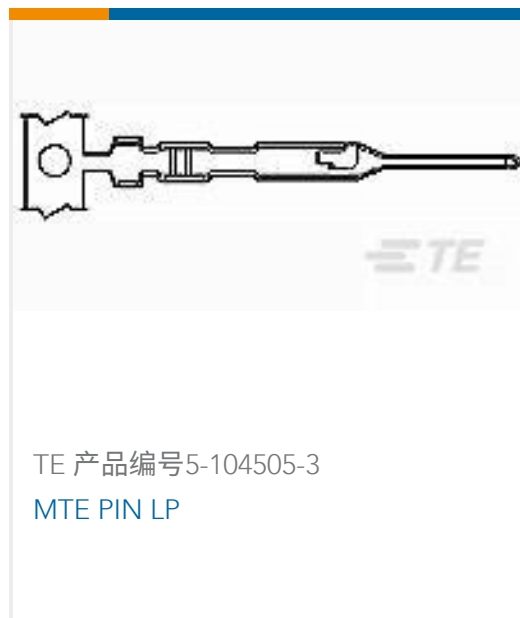
TE 产品编号5-104505-3 MTE PIN LP