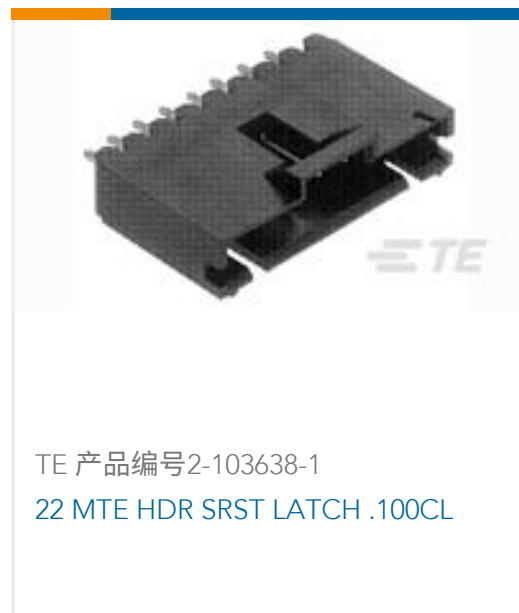
TE 产品编号2-103638-1 22 MTE HDR SRST LATCH .100CL