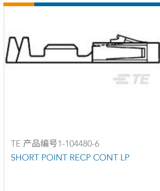
TE 产品编号1-104480-6 SHORT POINT RECP CONT LP