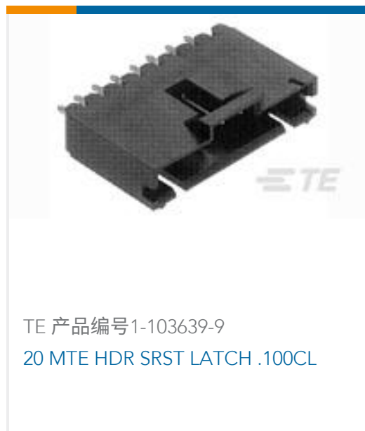
TE 产品编号1-103639-9 20 MTE HDR SRST LATCH .100CL