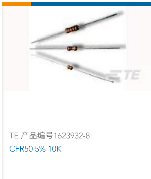
TE 产品编号1623932-8 CFR50 5% 10K