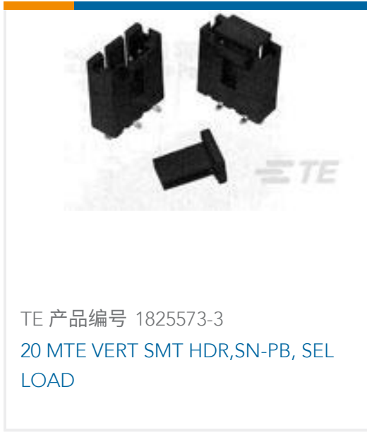
TE 产品编号 1825573-3 20 MTE VERT SMT HDR,SN-PB, SEL LOAD