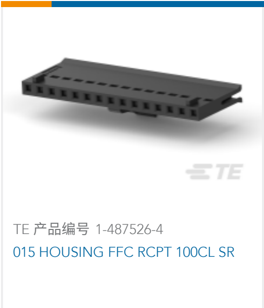
TE 产品编号 1-487526-4 015 HOUSING FFC RCPT 100CL SR