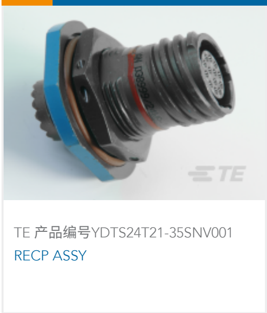
TE 产品编号YDTS24T21-35SNV001 RECP ASSY