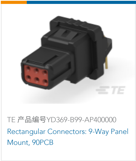
TE 产品编号YD369-B99-AP400000 Rectangular Connectors: 9-Way Panel Mount, 90PCB