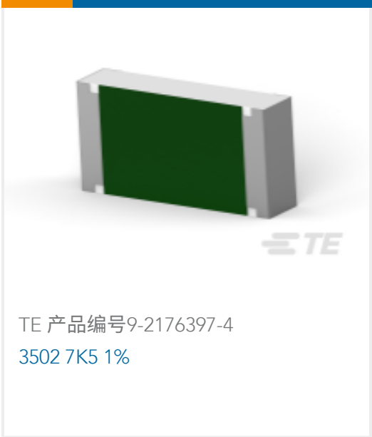
TE 产品编号9-2176397-4 3502 7K5 1%