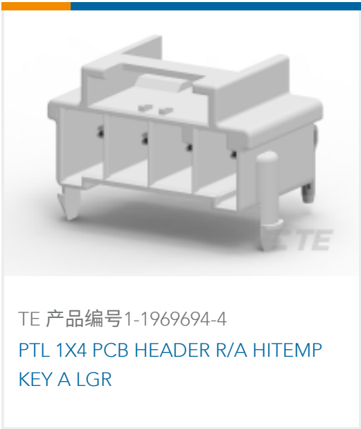
TE 产品编号1-1969694-4 PTL 1X4 PCB HEADER R/A HITEMP KEY A LGR