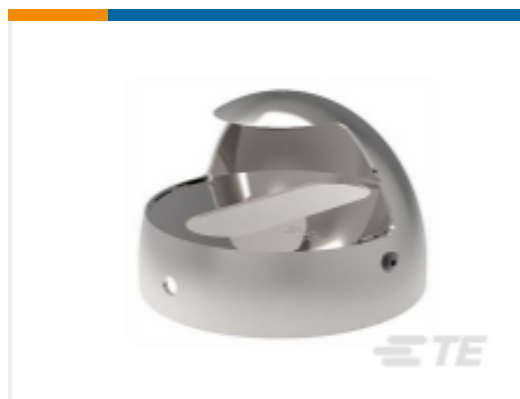
TE 产品编号993693-000 IR-500-39-RG-9-REFLECTOR