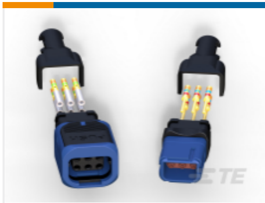
TE 产品编号YD369-P99-NS300000 369 9 WAY PLUG, 20/22 CONTACTS, SKT