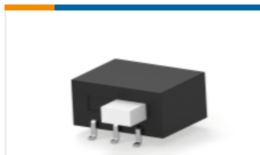
TE 产品编号1-1437581-1 ASE22RL=AUTOSLIDE DP