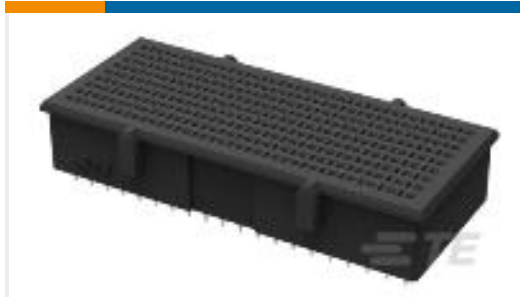
TE 产品编号2102161-1 Fortis Zd 3Pr 20Col Vert Full Shrd Assy