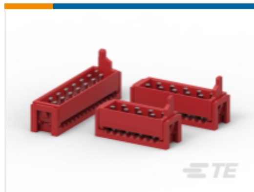
TE 产品编号7-215083-4 Male-on-Wire Connector, Micro-MaTch Entry