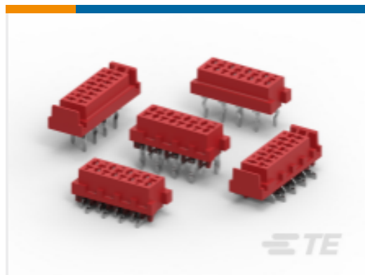
TE 产品编号1-215079-4 Female-on-Board Connector, Top Entry