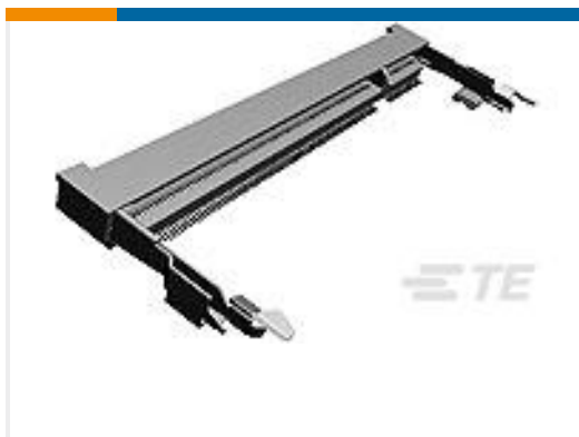
TE 产品编号1473149-4 SEMI-HARD TRAY ASSY DDR2 SODIMM 5.2H ST