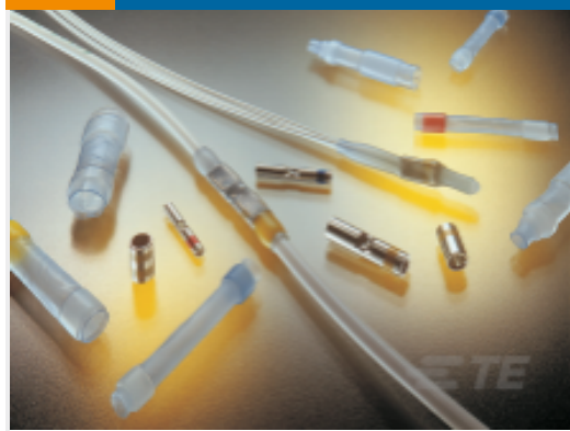
TE 产品编号1795440004 D-181-2222-90/9CS1270