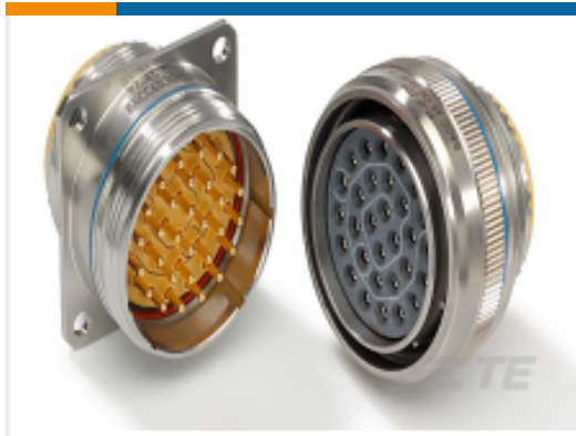
TE 产品编号ZPF000000000007718 983-0SE 24-30 S7 L