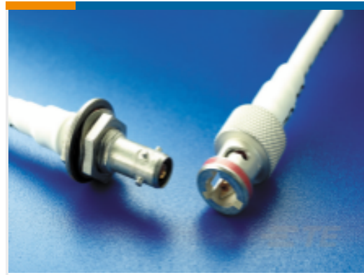
TE 产品编号613049-000 D-621-0436