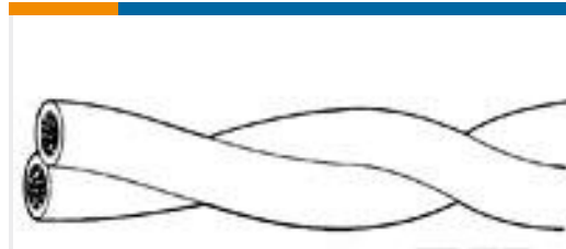
TE 产品编号413383-000 55PC0222-20-6/9