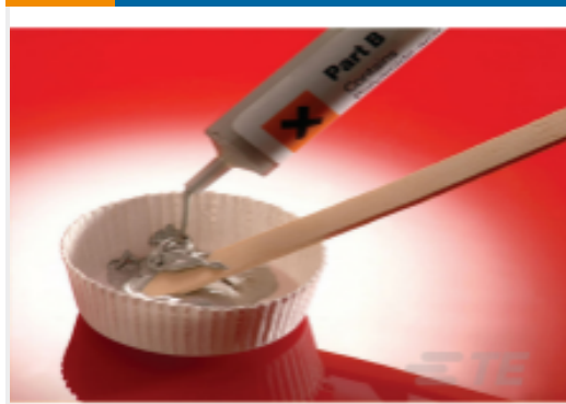
TE 产品编号369276-000 S1184-KIT-1