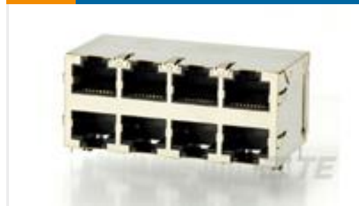
TE 产品编号5569257-1 STK MJ ASSY,8POS,2X4,SHLD,CAT5