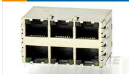
TE 产品编号5569256-1 STK MJ ASSY,8POS,2X3,SHLD,CAT5