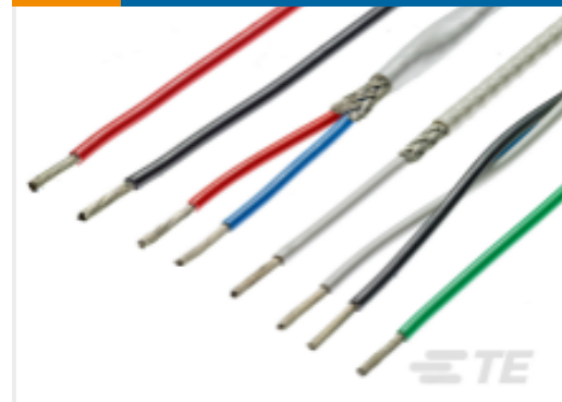
TE 产品编号515239-000 CTC-0057-20-9/5-9