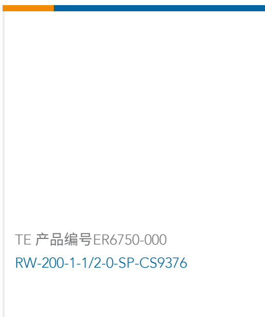
TE 产品编号ER6750-000 RW-200-1-1/2-0-SP-CS9376