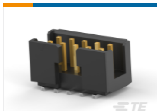
TE 产品编号1-2373376-0 10P,2MM,SHRD HDR,DRV,T,SMD,0.1 AU,TB