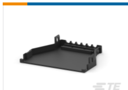
TE 产品编号1776695-1 Strain Relief, D5200, Dynamic AU,TB