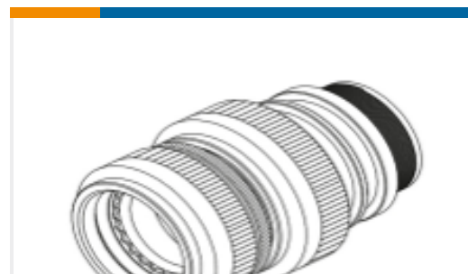
TE 产品编号873407-000 STXR41AB00-1616AI