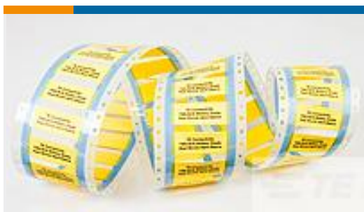
TE 产品编号002308-000 TMS-SCE-1K-3/4-2.0-0