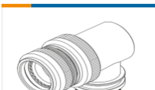
TE 产品编号EL6119-000 STXR40AZ00-0808AI