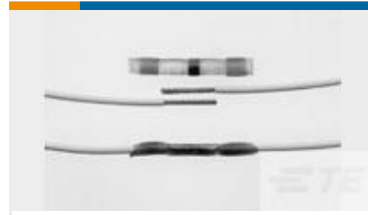
TE 产品编号D33598-000 B-152-9003