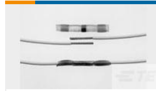
TE 产品编号F80600-000 B-152-9004