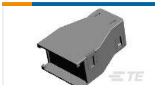
TE 产品编号1986185-1 Strain Relief,6 Posn,D5200 Dynamic. 2