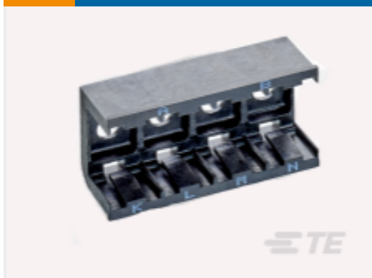
TE 产品编号DCR-1A-06 COMPOSIT RAIL