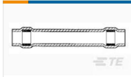
TE 产品编号D17660-000 D-200-82