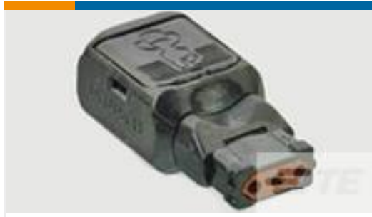
TE 产品编号D369-P33-NS1 369 3 WAY PLUG, CRIMP, SKT