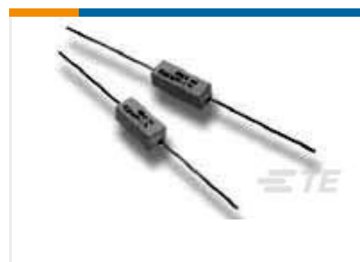
TE 产品编号1623819-7 SBL4 R01 5%