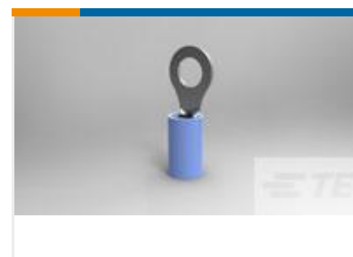
TE 产品编号130663 PIDG RING NYL