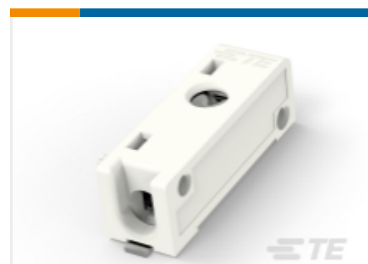
TE 产品编号2834006-1 RELEASE POKE-IN CONNECTOR_1POLES