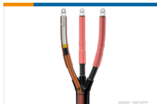
TE 产品编号E92435-063 POLT-12D/3XIH1