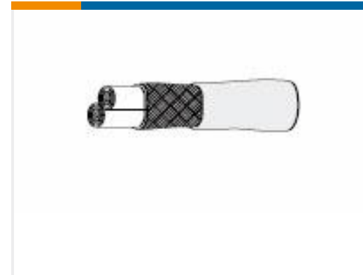
TE 产品编号955741-000 55PC1121-22-6/9-9