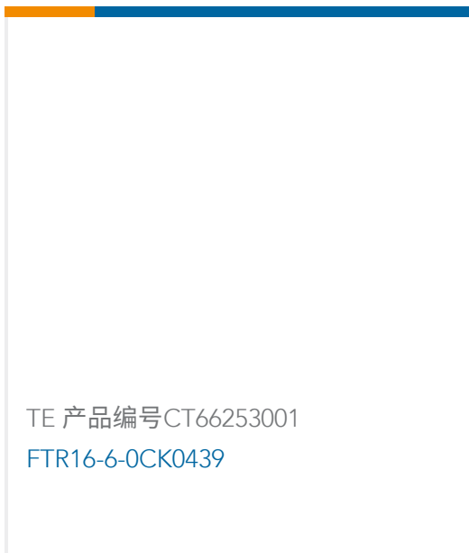
TE 产品编号CT66253001 FTR16-6-0CK0439