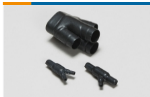
电缆转接点和分线点(2)