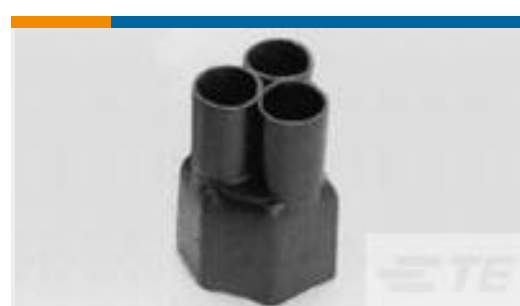
TE 产品编号195702-001 T3-9FR