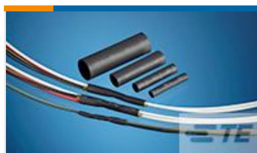
TE 产品编号7501716015 RBK-ILS-125-NR4-0-35MM