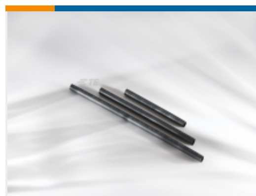
TE 产品编号EP91986001 SCT 热缩管