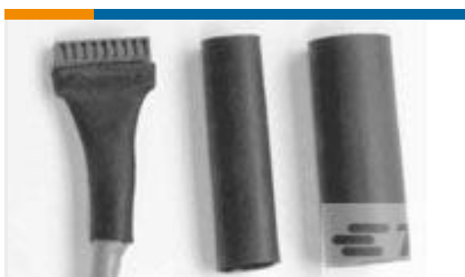
TE 产品编号1118016003 DWP-125-3/4-2-2IN