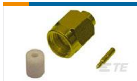
TE 产品编号1-1478903-0 SMA STR PLG DS RG402 GSS